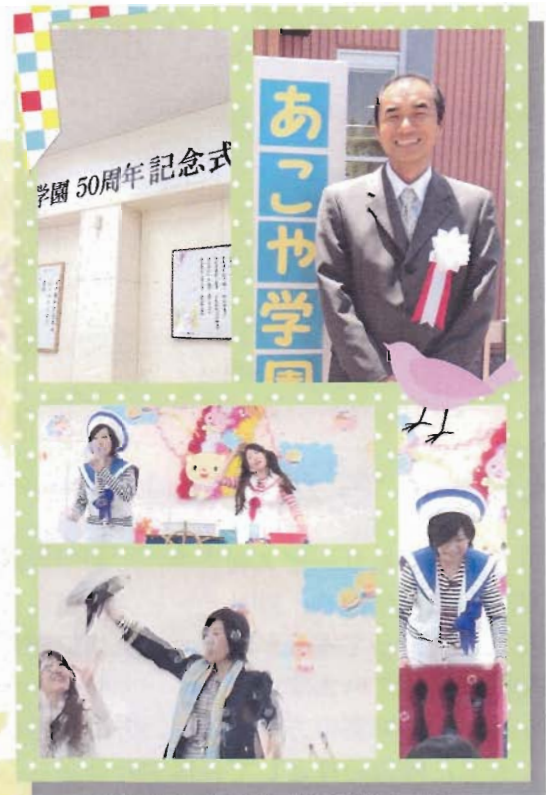
H25年5月17日 50周年記念式典

施設種別は変わりましたが、これまでの歳月に刻まれてきた学園への「願い」「思い」を大切にしながら、これからも、地域の全ての子ども